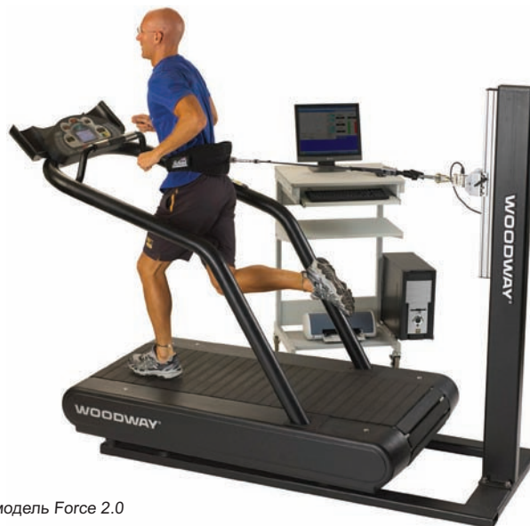
*модель Force 2.0