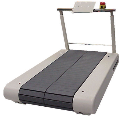
*Модель с опциональными передними поручнями для оценки движений на большой скорости